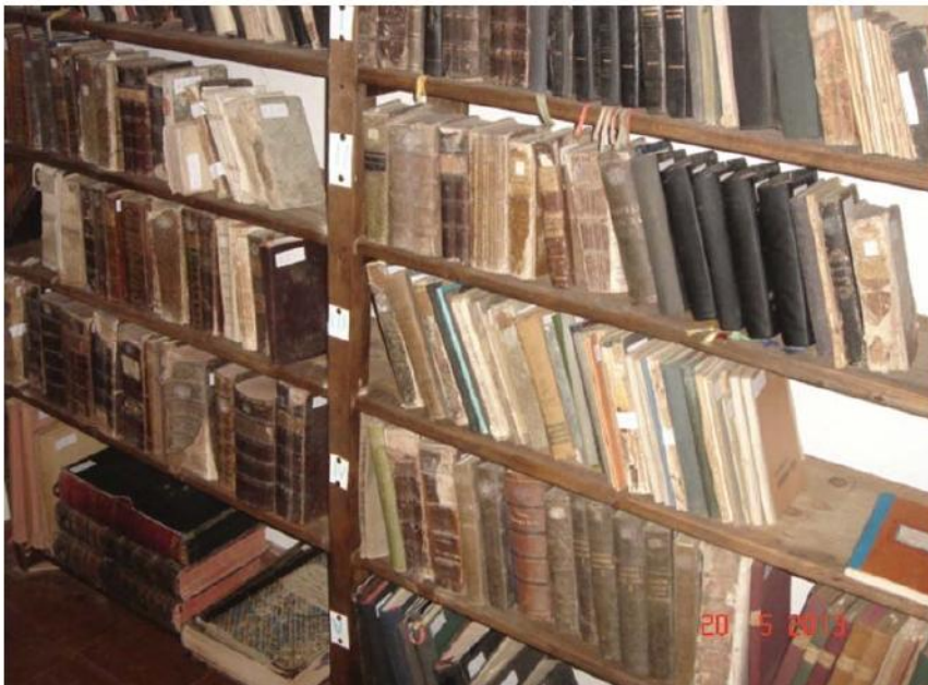
Stare knjige u arhivi