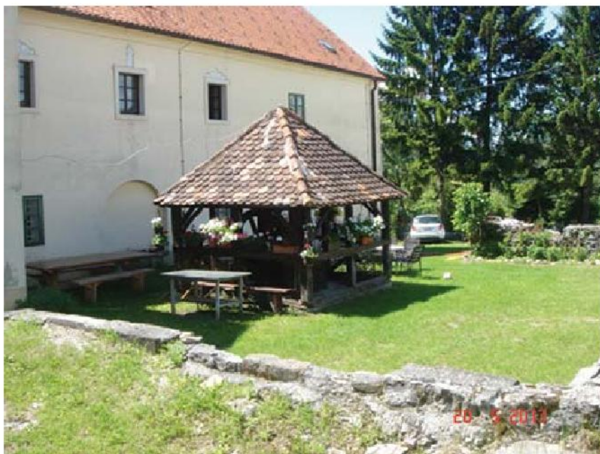
Ostaci zidina i stari bunar

Kako bi se jedna samostanska kuća proglasila formalnim samostanom, Crkva je tražila - i onda i danas - određene standarde za odvijanje zajedničkog života braće. U Kotarskom samostanu bilo je dovoljno mjesta za život 14 braće franjevac, a i crkva Sv. Lenarta bila je dovoljna za primanje većeg broja proštenjara na blagdan Sv. Lenarta, opata 6. lipnja.. 5