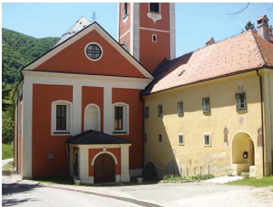
Obnovljena crkva i ulaz u samostan

Do danas je sačuvan samo zapadni trakt. Sjeverni i istočni samostanski trakt su srušeni vremenskim nepogodama i nebrigom župnika na Kotarima, i uklonjeni. 6